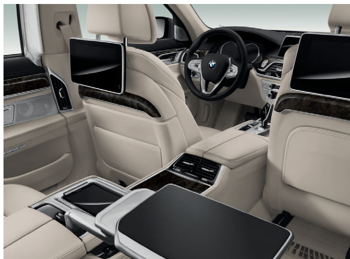
Pakiet Executive Lounge